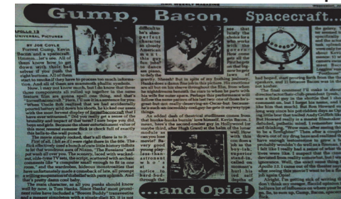
Antiguo Periódico del Colegio Americano